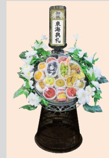
1基 ¥10,800(税込) 1基 ¥16,200(税込)